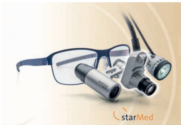
Ryc. 1 Kamera full HD starCam (starMED GmbH & Co. KG, Grafing, Niemcy)

Szczegółowe parametry techniczne kamery opisano w tabeli 2 [9].