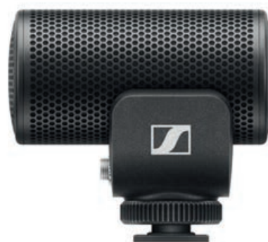
Ryc. 4 Mikrofon kierunkowy MKE 200 firmy Sennheiser

Przekaz audio dokonywany jest przez mikrofon wysokiej czułości. Przykładem może być mikrofon kierunkowy MKE 200 firmy Sennheiser (ryc. 4) lub inny mikrofon kierunkowy np. Boya BY-BM3031 (Mitoya). Ten pierwszy jest wyposażony w superkardioidalną kapsułę, która zapewnia ostrość i szczegółowość nagrań, jednocześnie odseparowując niepożądane szумы tła. Mikrofon posiada osłonę przeciwwietrzną i mocowanie antywstrząsowe, zapewniające czysty dźwięk podczas nagrania wideo w ruchu, poziom