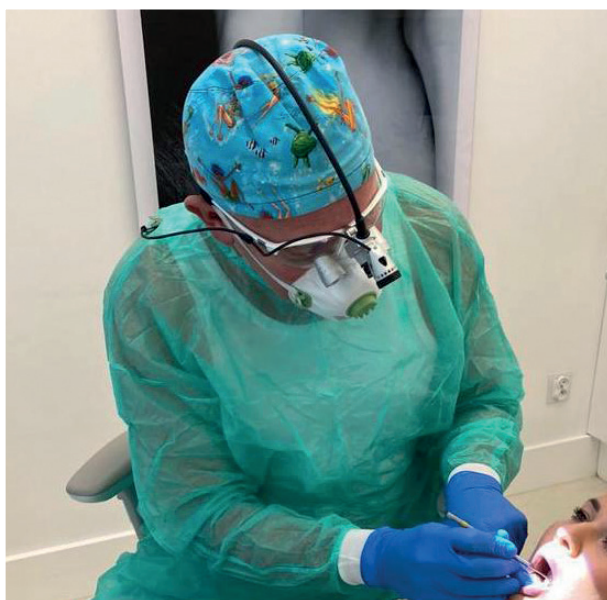
Ryc. 5. Autor podczas e-nauczania, stosując kamerę full HD starCam (starMED GmbH & Co. KG, Grafing, Niemcy) oraz Lupy StarVision Ex 3.0.

Dotychczas szkolenie praktyczne lekarzy odbywało się poprzez możliwość bezpośredniej asysty lekarzowi bardziej doświadczonemu. Lekarz szkolący miał możliwość przekazania swej wiedzy młodszemu koleżance czy koledze w rozmowie bezpośredniej podczas zabiegu. Istniała również możliwość korekty studenta czy lekarza stażysty. W obecnej dobie pandemii i kolejno wprowadzonych zasadach zdalnego nauczania zastosowanie kamery starCam wydaje się być zasadne. Możliwość bezpośredniego