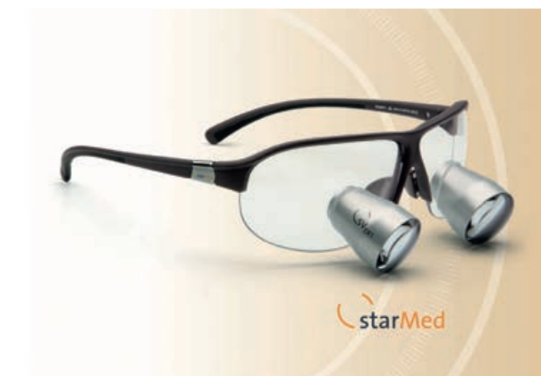
Ryc. 2 Lupy powiększające- Lupy StarVision Ex 3.0

Wprowadzone zdalne nauczanie studentów znajduje interesujące zastosowanie dla kamery starCam, zamontowanej do okularów lekarza i lup powiększających stosowanych podczas zabiegu (ryc.2).