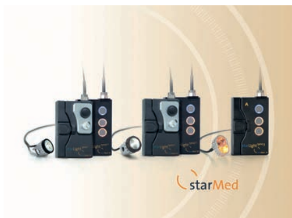
Ryc. 3. Oświetlenie starLight nano (starLight nano 1/ nano 1.1: oświetlenie szerokie; starLight nano 2/ nano 2.1: oświetlenie zogniskowane; starLight nano 3: barwne diody LED)

Dodatkowy operator kamery -konieczny w trakcie zabiegów transmitowanych dotychczas- nie jest potrzebny. Pojawiające się niedokładności przekazu związane ze znalezieniem odpowiedniej ostrości i dokładności przekazu, szczególnie przy zabiegach wykonywanych wewnątrz jamy ciała, został wyeliminowany poprzez zastosowanie stabilizacji obrazu jak i wysokiej rozdzielczości powiększeń. Kamera nagłowna, dostosowana ostrością do ostrości wzroku operatora wyposażonego w lupy zabiegowe idealnie przekazuje obraz na urządzenie rejestrujące, jak i, dzięki możliwości podłączenia poprzez złącze USB 3.0 lub 2.0 do komputera przekazuje obraz dalej, poprzez np. platformę komunikacyjną Microsoft Teams do sali dydaktycznej lub do lokalizacji, gdzie student odbywa nauczanie zdalne. Odpowiednie oświetlenie pola operacyjnego uzyskano dzięki oświetleniu starLight nano 2/ nano 2.1 (oświetlenie zogniskowane). Ten kompaktowy i przenośny system LED zapewnia optymalne oświetlenie pola zabiegowego. Właściwe oświetlenie to kluczowy element dobrej widoczności podczas zabiegu. System może być montowany na